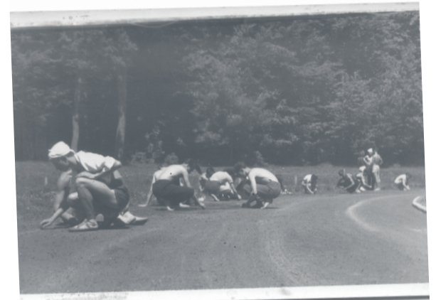
Zdjęcie u góry - sędziowie na mecie 100m. Zdjęcie niżej - ... przebijający na obozie przygotowują bieżnię do zawodów

Rady razem wzięci. Nawet cegłę, cement i papę mógł załatwić! 3. Załatwić w PRL nie znaczyło dać pieniądze na kupno.