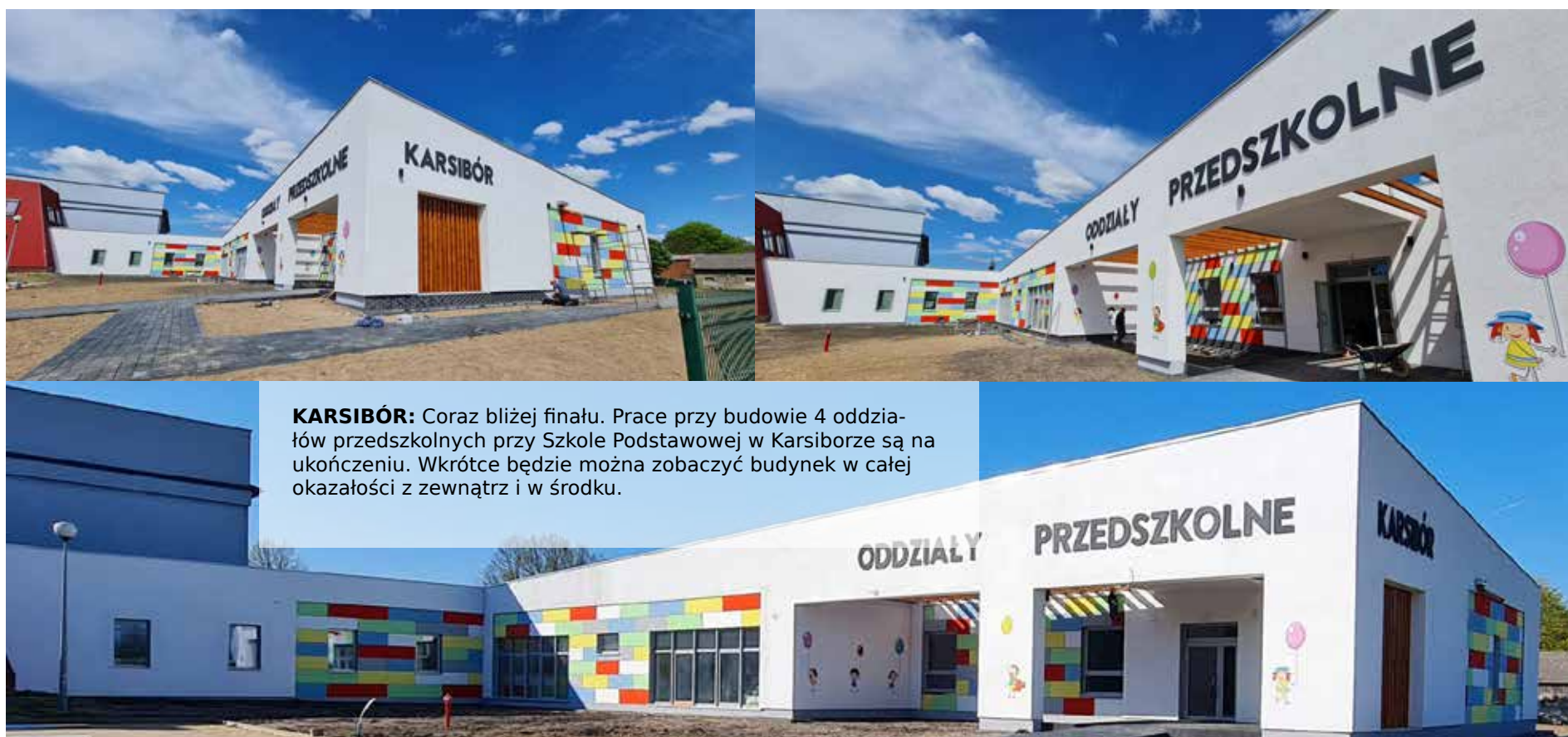
KARSIBÓR: Coraz bliżej finału. Prace przy budowie 4 oddziałów przedszkolnych przy Szkole Podstawowej w Karsiborze są na ukończeniu. Wkrótce będzie można zobaczyć budynek w całej okazałości z zewnątrz i w środku.