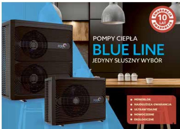
POMPA CIEPŁA 8kW 1-fazowa R32 BL-8-1, cena 16 000netto