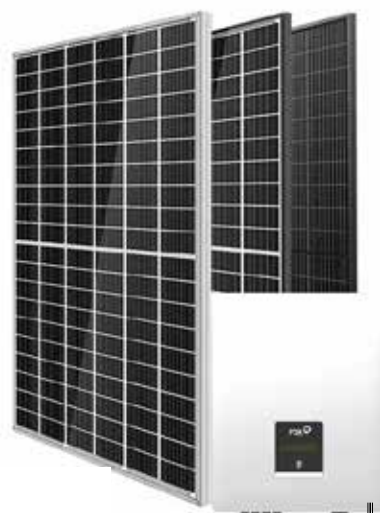
Falownik Hybrydowy FoxESS H1 - 3.7 - E + 8 paneli Riesen 435W - 10 512netto