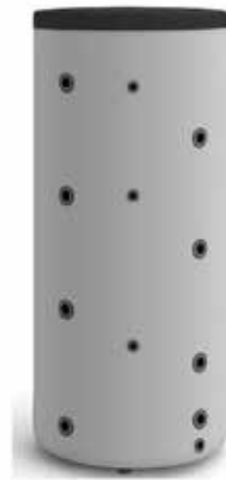
BUFOR GALMET 300I - 2200netto