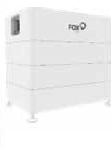
MODUŁ BATERII MAGAZYNUJĄCEJ MIRA HV25 wraz z szafką i BMS 9,52kW - 18 500netto