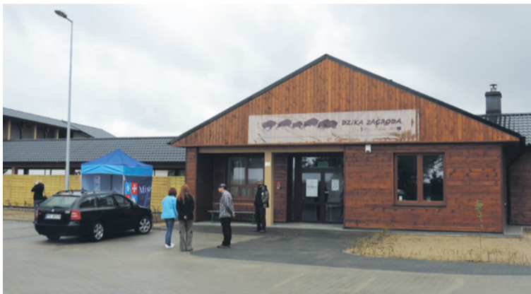
▲ Dzięki środkom z UE powstała Dziką Zagroda w Jabłonowie.

występujemy, lecz nie możemy próbować narzucać swoich warunków całej wspólnoty. Przyszły unijny budżet to ogromne nadzieje dla samorządów, ponieważ bez tych środków realizacja większości inwestycji nie będzie możliwa.