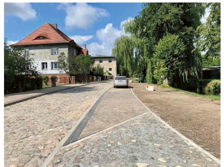
▲ Pieniądze z UE pozwoliły także na wyremontowanie mirosławieckiej starówki.