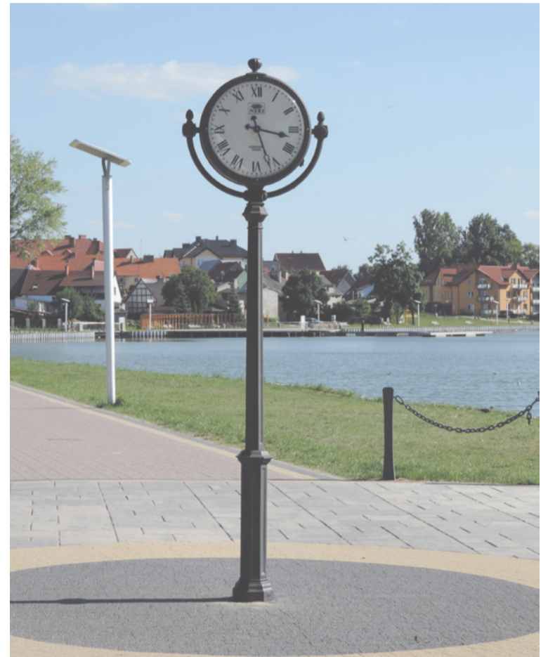
▲ I wałęcka promenada.