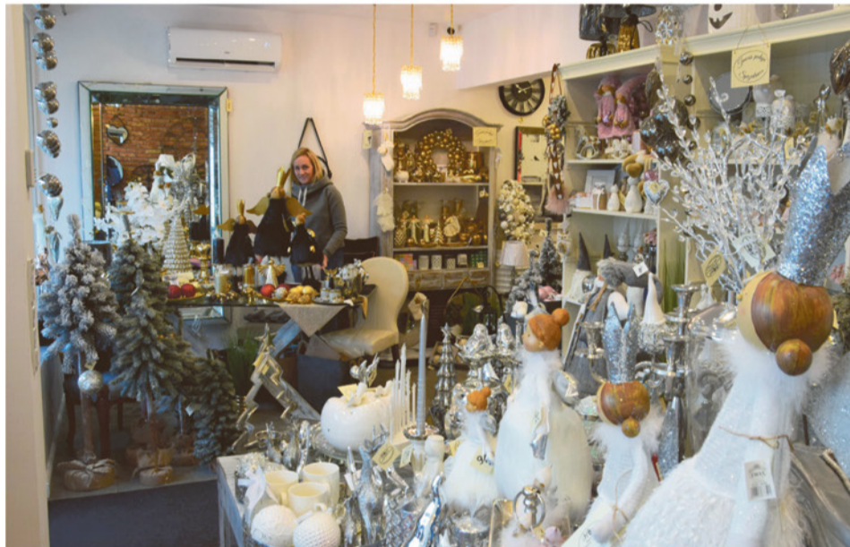
Z pożyczki unijnej skorzystał sklep „Home Sweet Home”.

Oficjalna terminologia może nieco odstraszać, ale przedsiębiorcy, którzy skorzystali z mikropożyczek na rozpoczęcie działalności gospodarczej przyznają, że byli zaskoczeni, jak łatwo udało się zdobyć fundusze.