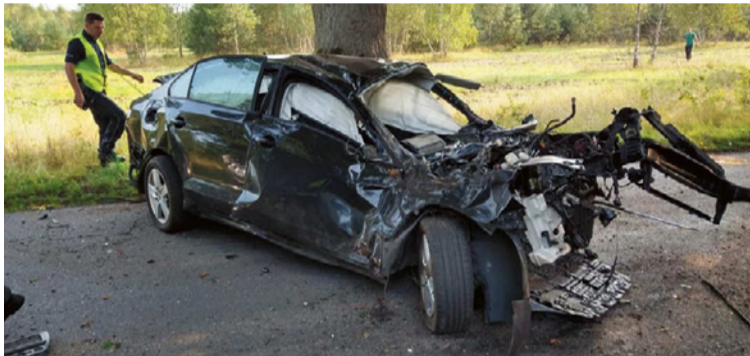
▲ Wypadek między Szwecją a Zdbicami, fot. OSP Szwecja.

Kolejny tragiczny wypadek zdarzył się w nocy 22 września, również na drodze krajowej nr 10, tym razem w okolicy Witankowa. Tam 26-letni