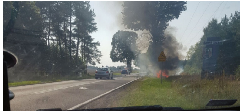
▲ Wypadek pod Rusinowem, fot. Czytelnika.

kierowca, mieszkaniec gminy Wałcz, uderzył volkswagenem golfem w jadące prawidłowo z przeciwnego kierunku iveco. Zginął na miejscu. Badania wykazały, że prowadził będąc pod wpływem środków odurzających.