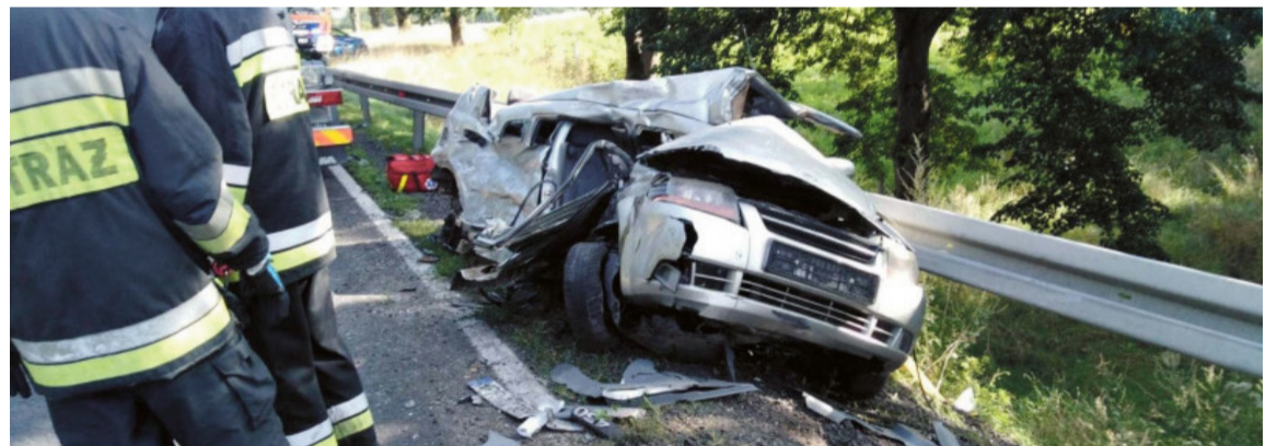
▲ Wypadek w okolicy Jabłonkowa, fot. Strażacy Powiatu Wałeckiego w Akcji.

- Kary za prowadzenie pojazdów pod wpływem alkoholu lub środków odurzających i za spowodowanie wypadków w takim stanie są bardzo poważne, a dodatkowe świadczenia, zakazy i konsekwencje dotkliwe - mówi prokurator rejonowy Piotr Łosiewski. - Okazuje się jednak, że kara nie odstrasza ludzi od popełniania tych czynów. To plaga naszych czasów, z którą nie wiadomo jak walczyć. - To skrajna nieodpowiedzialność