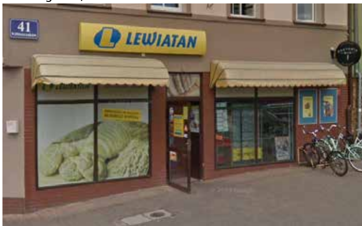
Sklep Lewiatan : Wałcz, ul.Kilińszczaków 41

„ To dziś chyba jedyne rozwiązanie, aby tworzyć wspólne grupy zakupowe dając konkurencyjne ceny klientom, i to zdecydowanie się udaje. Dziś ceny w sieciach takich jak Lewiatan nie odbiegają tak mocno od tych w sklepach wielkopowierzchniowych, a nawet często zdarza się, że promocje nasze są atrakcyjniejsze niż w zagranicznych sieciach. Mamy dodatkowo lepszy kontakt z klientami i jesteśmy bardziej elastyczni jeśli chodzi o dobór asortymentu.”