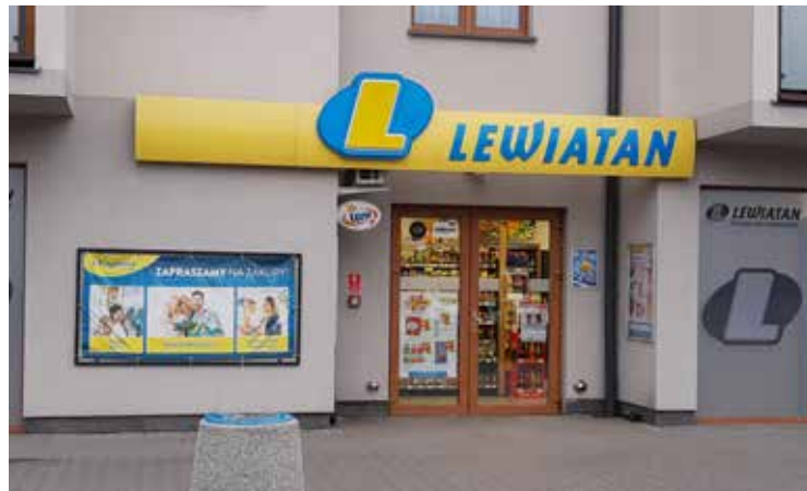
Sklep Lewiatan : Wałcz, ul. Obrońców Westerplatte