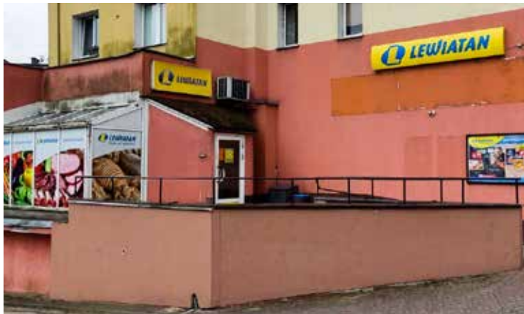
Sklep Lewiatan : Wałcz, ul.WojskaPolskiego 27D

Dziś większość sklepów odczuwa spadki obrotów w porównaniu z ubiegłymi latami, mimo że ceny znacząco wrosły i to szczególnie na produkty spożywcze. Dużo osób przerzuciło się na zakupy w dyskontach i supermarketach, które kuszą kampaniami reklamowymi. Niestety czasami robiąc zakupy w tych sklepach, oszczędności osiągnięte są złudne.