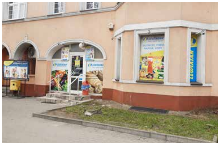
Sklep Lewiatan : Wałcz, ul.Dworcowa

Duże sieci handlowe, nie mają możliwości zaoferowania produktów lokalnych choćby od miejscowych rolników lub małych producentów działających w okolicy. Sieć Lewiatan umożliwia to swoim partnerom i każdy właściciel sklepu sam dobiera strategię dostaw i szybko może wprowadzić do oferty choćby ekologiczne produkty lokalnych przedsiębiorców, lub produkty regionalne. W najbliższym czasie, według ekspertów, będzie miało duże znaczenie i stworzy przewagę lokalnych