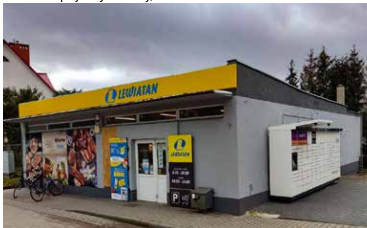
Sklep Lewiatan: Wałcz, ul.Żeromskiego