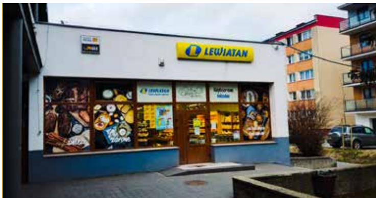
Sklep Lewiatan : Wałcz, ul.WojskaPolskiego 95

szego miasta, czy powiatu.” Obecnie duże sieci spożywcze nabierają rozpędu i mocno korzystają z topniejącej ilości mniejszych sklepów spożywczych. Tępo likwidacji mniejszych sklepów spożywczych jest zatrważające. Dodatkowo małe podmioty obciążone są zwiększonymi stawkami za prąd czy gaz i nie mogą konkurować pod względem minimalizacji kosztów z koncernami, które zakupują energię w dużym wspólnym wolumenie. Walka jest zdecydowanie nierówna. Warto zatem mieć świadomość, że gdy zostaną tylko duże sieci sklepów wielkopowierzchniowych, to