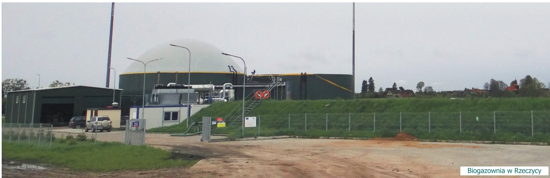
Biogazownia w Rzeczycy

Mieszkańców Dęboleki (gm. Wałcz) zelektryzowała wiadomość o pomysśle budowy w ich miejscowości biogazowni. Wprawdzie inwestor twierdzi, że ewentualna budowa - jeżeli w ogóle będzie podjęta - rozpocznie się dopiero za kilka lat i wszystko będzie prowadzone zgodnie z przepisami, jednak mieszkańców to nie uspokaja.