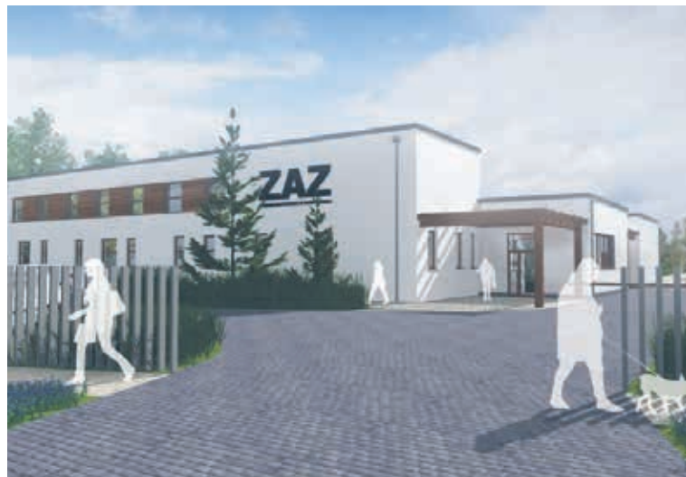
Zakład Aktywności Zawodowej w Powiecie Wałęckim.