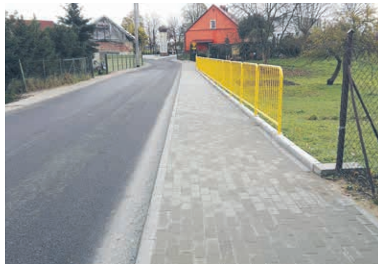
Przebudowa drogi w miejscowości Strączno z udziałem środków zewnętrznych.