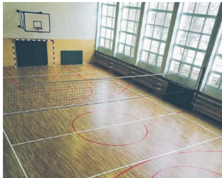
Remont i modernizacja parkietu przy PCKZiU.