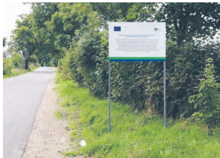
Przebudowa odcinka drogi do Karsiboru. Inwestycja dofinansowana z PROW.

Dużo środków finansowych otrzymują szkoły. W przyszłym roku Powiat będzie budować warsztaty właśnie dzięki środkom z kontraktu. Jest szansa na rozszerzenie kontraktu, aby stworzyć klasy patronackie dla firm z terenu powiatu. Do tej pory w ramach kontraktu największą ilość środków udało się pozyskać w 2018, apogeum nastąpi w roku 2020. To sukces samorządu powiatowego, który trudno podważyć.