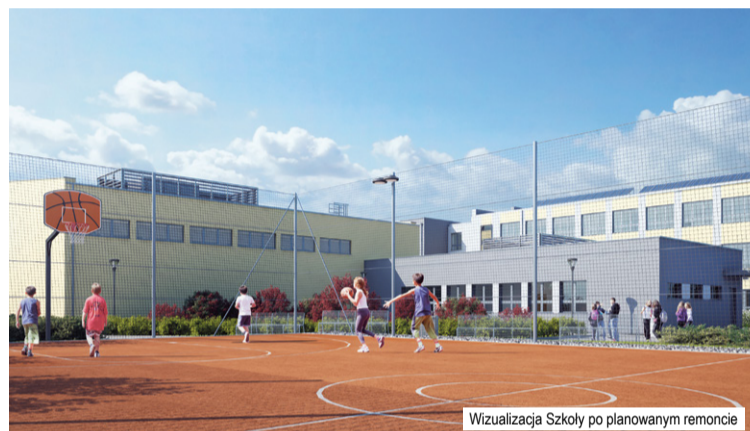
Wizualizacja Szkoły po planowanym remoncie

Wielkopolskie Samorządowe Centrum Edukacji i Terapii w Starej Łubiance, ul. KOŚCIUSZKOWCÓW 2A 64-932 STARA ŁUBIANKA; tel./fax: 67 216 01 14; e-mail: zspstaralubianka@op.pl ; www.zspstaralubianka.pl