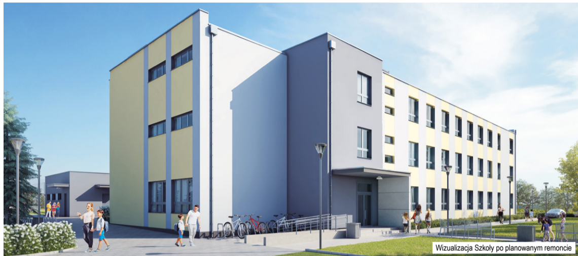
Wizualizacja Szkoły po planowanym remoncie

Lubisz muzykę? Śpiewasz? Grasz? Mamy zespół muzyczny!