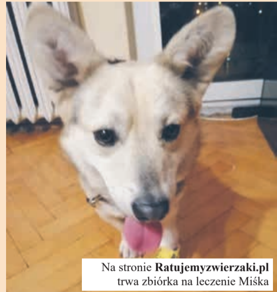
Na stronie Ratujemyzwierzaki.pl trwa zbiórka na leczenie Miśka