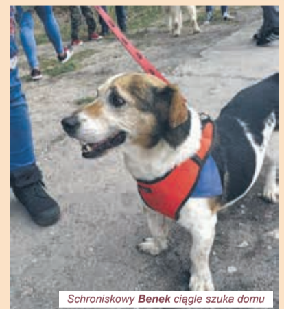
Schroniskowy Benek ciągle szuka domu

Choć spora część osób uważa, że mieszkanie, kundelki są najwspanialsze, może być tak, że zapragniesz psa konkretnej rasy. Wciąż nic nie stoi na przeszkodzie, by dać dom psu ze schroniska- wbrew pozorom mieszka w nich wiele psów rasowych- które były nietrafionym prezentem lub chwilowym kaprysem. Czasami opiekunowie rezygnują z opieki nad psem rasowym, gdy okazuje się, że nie mogą sprostać jego wymaganiom. Nawet jeśli znalezienie pożądanego przy-