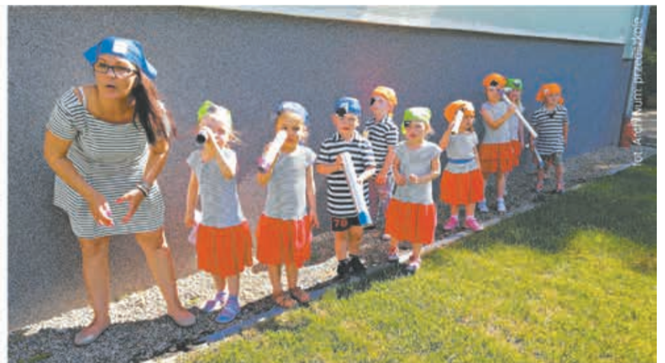
W przedszkolu „Miś-Krono” wszystkie zajęcia są bezpłatne

Podobnie jest w szczecińskim przedszkolu „Dzieńdoberek” – tutaj też rodzice nie ponoszą żadnych opłat. A to tym ważniejsze, że do placówki przy ul. Żubrów 3 uczęszczają dzieci o specjalnych potrzebach rozwojowych. Maluchy przebywają w przedszkolu około siedmiu godzin i jest to czas