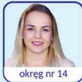
okręg nr 14