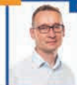
Krzysztof Stanisław MIKOŁAJCZYK