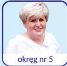
okręg nr 5