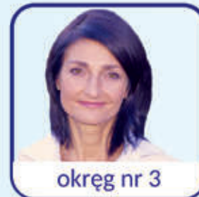
okręg nr 3