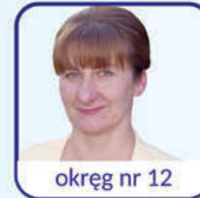
okręg nr 12