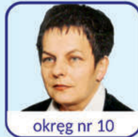
okręg nr 10