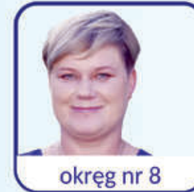
okręg nr 8