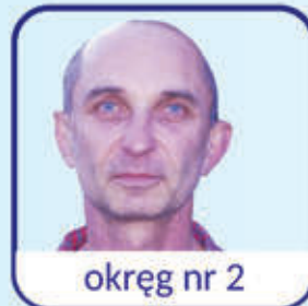
okręg nr 2