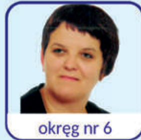
okręg nr 6