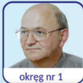
okręg nr 1