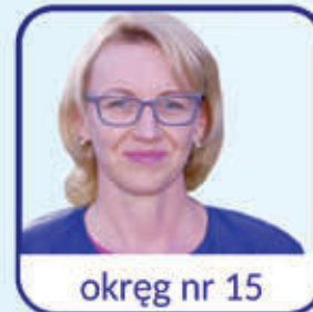
okręg nr 15