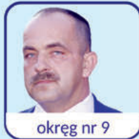
okręg nr 9