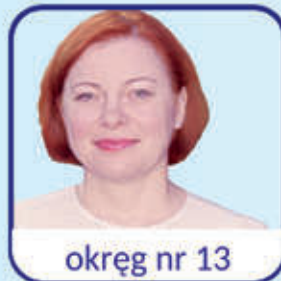
okręg nr 13