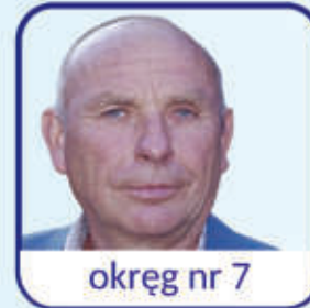
okręg nr 7