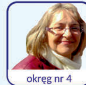
okręg nr 4