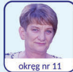
okręg nr 11