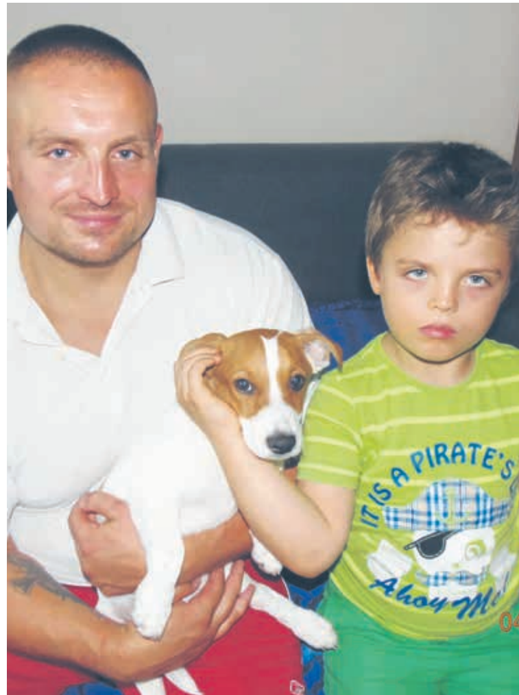
Nasz czworonożny przyjaciel mieszka z nami od trzech miesięcy