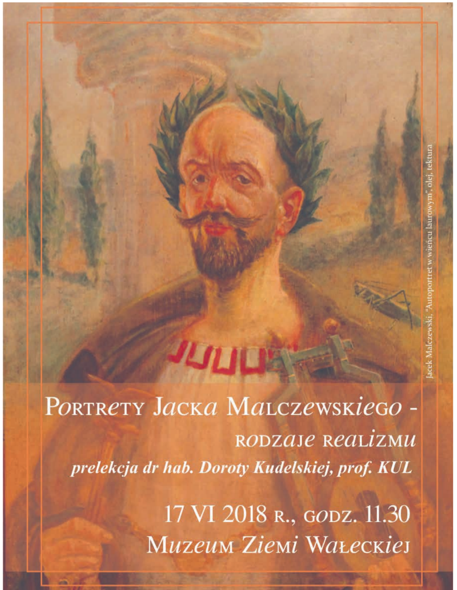
Jacek Malczewski, „Autoportret w wienku laurowym”, olej, tektura