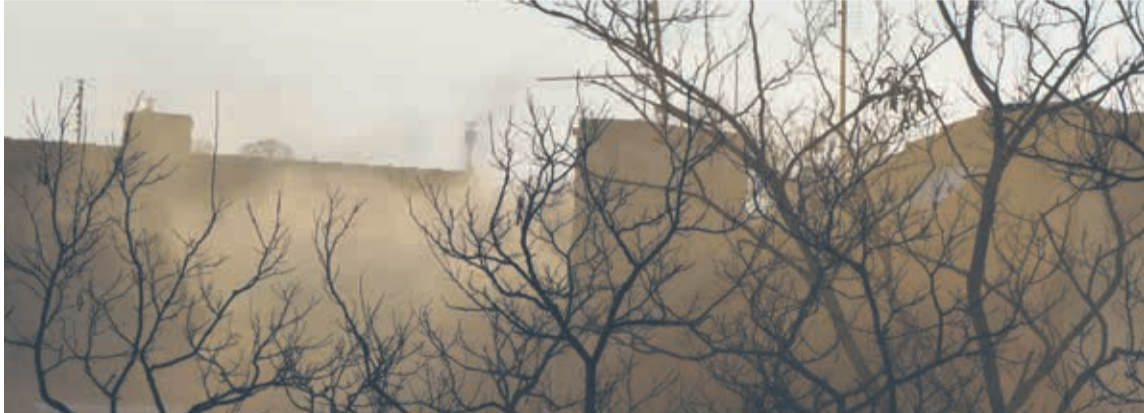
Mieszkańcy Powiatu Wałeckiego nie muszą oglądać takich widoków. Przy wsparciu Funduszu mogą uzyskać dofinansowanie na wymianę starych pieców na ekologiczne źródła ciepła – kotły na biomase, pompy ciepła i kondensacyjne kotły gazowe.

Rocznie z powodu zanieczyszczeń powietrza w Polsce umiera nawet 45 tysięcy osób! To tak, jakby z mapy zniknęło miasto wielkości Kołobrzegu lub Szczecinka. Jakość powietrza nie poprawi się, jeśli do starych i nieefektywnych kotłów i pieców będzie trafiać paliwo niskiej jakości. Ekologiczną alternatywą są źródła ciepła na biomase, pompy ciepła czy kotły gazowe. Atrakcyjne dofinansowanie ich zakupu proponuje Wojewódzki Fundusz Ochrony Środowiska i Gospodarki Wodnej w Szczecinie.