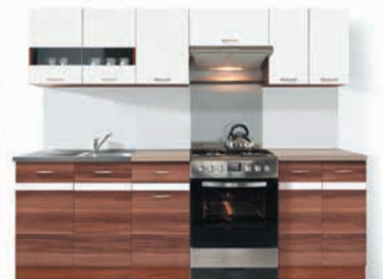
Zestaw Junona 2,40 Cena 699.00 zł. - różne kolory

Wałcz, Dom Handlowy, ul. Dworcowa 3 tel. 67 250 06 04