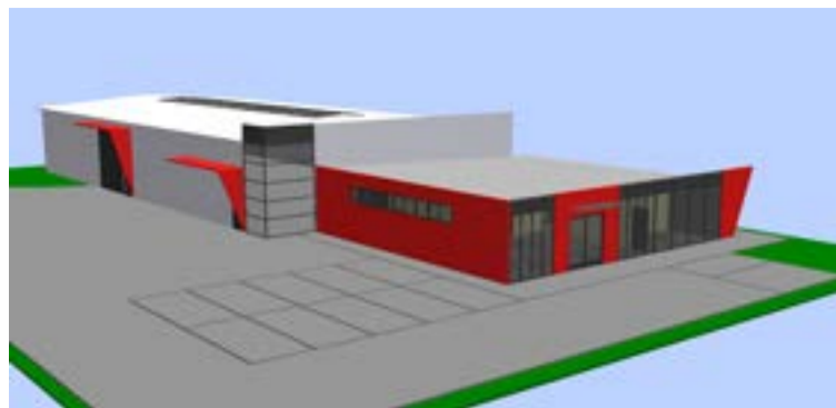
Wizualizacja hali o powierzchni ok. 1.000 m 2 , jaką ALBOR zamierza wybudować.