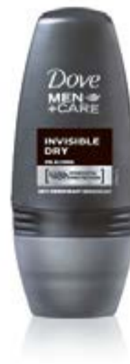
Antyperspirant Dove Man+Care Invisible Dry

Gęsty i całkiem wydajny. W przeciwieństwie do niektórych produktów, Axe oferuje męski zapach skomponowany z nut cytrusa i mięty delikatnie wsparty cydrem. Odświeżający żel pod prysznic spodoba się każdemu, kto chce dobrze rozpocząć lub zakończyć dzień. „Czarna” nazwa dobrze oddaje ciemny, mocny, pozbawiony kwiatowych nut aromat. Zapach jest jednocześnie nienachalny, więc nie będzie kłócił się z wybranymi perfumami.