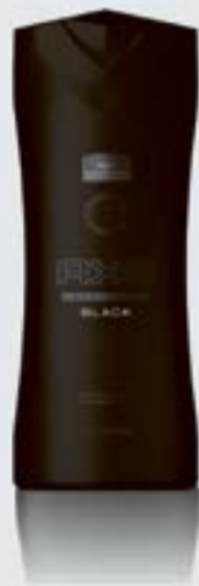
Żel pod prysznic Axe Black

Gęsty i całkiem wydajny. W przeciwieństwie do niektórych produktów, Axe oferuje męski zapach skomponowany z nut cytrusa i mięty delikatnie wsparty cydrem. Odświeżający żel pod prysznic spodoba się każdemu, kto chce dobrze rozpocząć lub zakończyć dzień. „Czarna” nazwa dobrze oddaje ciemny, mocny, pozbawiony kwiatowych nut aromat. Zapach jest jednocześnie nienachalny, więc nie będzie kłócił się z wybranymi perfumami.