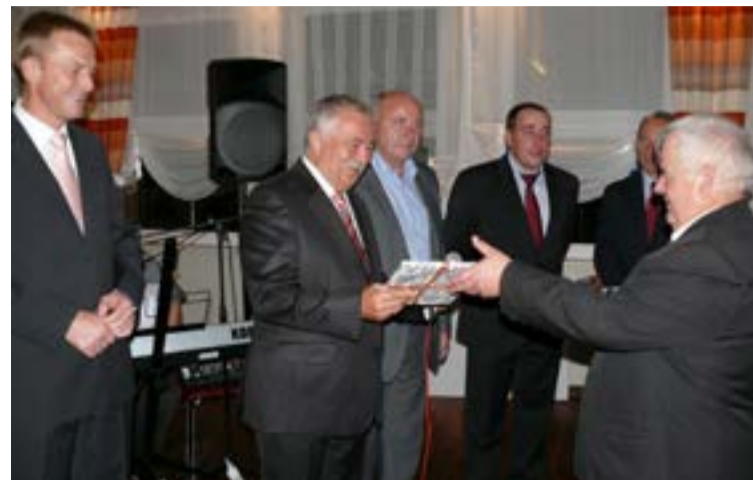
W Warsztatach udział biorą parlamentarzyści i samorządowcy...

Dzisiaj Warsztaty Nadzoru Inwestycyjnego w Wałczu to jedno z najistotniejszych spotkań branżowych w Polsce, na które przyjeżdżają ludzie z całego kraju, a kilka lat temu rozszerzono ich zakres, zapraszając do udziału w nich gości z Ukrainy. To także wspaniała okazja do pokazania najważniejszych nowości w szeroko pojmowanej dziedzinie budownictwa, ale też możliwość obejrzenia wielu już zabytkowych form czy budowli, których historia i dzień dzisiejszy przedstawiane są w ramach Europejskich Dni Dziedzictwa, a których naprawdę nie brakuje w rejonie samego Wałcza, jak również jego pobliskich okolic. Do Wałcza rokrocznie przyjeżdża co najmniej 100 osobowa reprezentacja różnych środowisk, branż czy samorządów, aby móc wymienić swoje doświadczenia; na przestrzeni minionych 18 lat, bardzo wielu z tych ludzi bywało tu dwa, trzy i więcej razy. Jak sami podkreślają - tutaj warto przyjechać z wielu powodów, a jednym z najważniejszych jest ten, że sama konferencja odbywa się w naprawdę przepięknie położonym, czystym i pełnym uroku Wałczu.