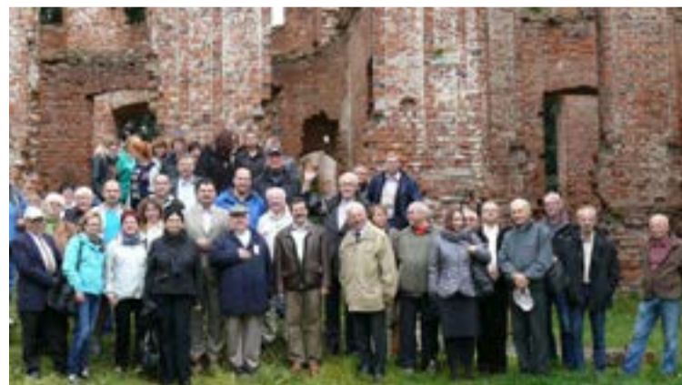
Od co najmniej 10 lat uczestnicy wałeckiego sympozjum mają okazję zwiedzać okoliczne zabytki w ramach EDD; na zdjęciu przy ruinach zamku w Kłębowcu.