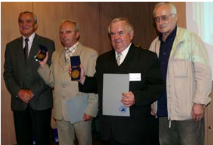
Walecka impreza jest często okazją do wręczenia najważniejszych wyróżnień w branży budowlanej.