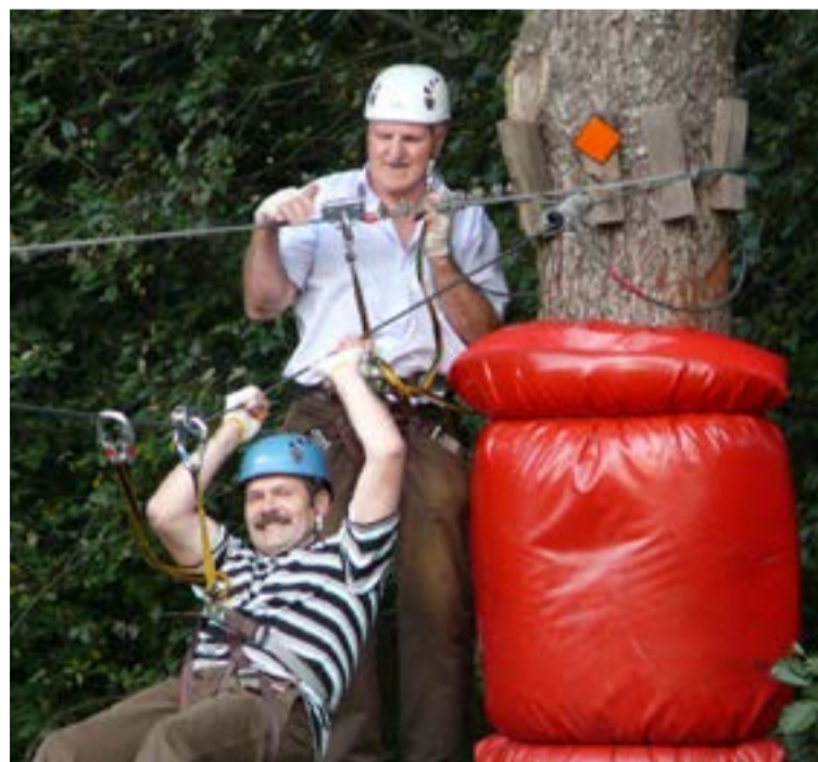
Bardzo często uczestnicy Warsztatów mogą także znaleźć chwilę na relaks czy to w Parku Linowym Rudnica, czy też pływając kajakiem po okolicznych rzekach, a wieczorem po zakończeniu obrad pierwszego i drugiego dnia pływając na basenie COS OPO.