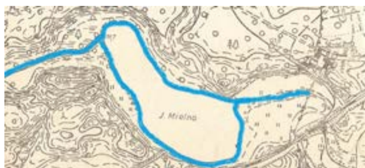
Mapka: Atlas jezior woj. pilskiego oprac. w WBGiTR w Pile pod red. St. Mazurka.

Użytkownikiem zbiornika jest Zakład Rybacki w Wałczu, w którym można wykupić zezwolenie (ul. Bracka 1,