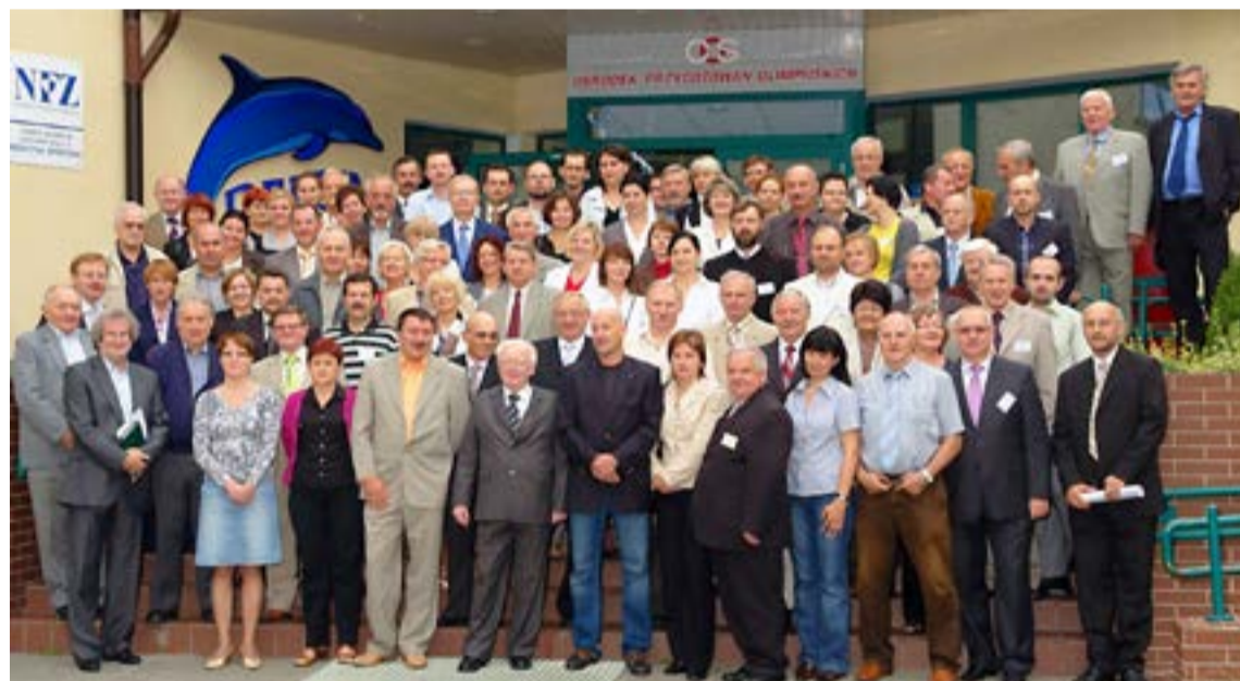
W dorocznych Warsztatach Nadzoru Inwestycyjnego w Wałczu uczestniczy od lat liczna grupa przedstawicieli różnych branż budowlanych.

Jedną z najważniejszych konsekwencji przeprowadzonej na początku 1999 roku reformy administracyjnej Polski, okazało się znaczne wzmocnienie roli i znaczenia województw oraz powiatów. Zwłaszcza tym drugim przydzielono szereg zadań, które do momentu reformy, były niejako „porozkładane” (nie zawsze szczęśliwie) w kompetencjach miast czy gmin.