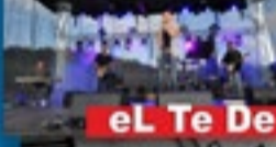
eL Te De