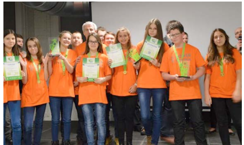
Chwiramu wzięła udział w konkursie w tym roku. Z tego co udało nam się ustalić, młodzi konstruktorzy i ich rodzice nie poddają się i ciągle zbierają pieniądze na wyjazd na Florydę. mk

światowego, który odbył się pod patronatem NASA w USA. Niestety ich wyjazd okazał się niemożliwy z powodu braku środków. Nie tylko należało zgromadzić znaczną sumę pieniędzy, ale także zamówić i sprowadzić z zagranicy obowiązkowy zestaw do skonstruowania i oprogramowania robotów na konkurs, przygotować drużynę do pracy z nowym zestawem, wystąpić o paszporty i wize, zakupić bilety na samolot, zarezerwować nocleg... Najtrudniejszym okazało się jednak zamówienie i otrzymanie zestawu niezbędnego do udziału w konkursie. W związku z tym organizator konkursu w USA zgodził się, aby drużyna z