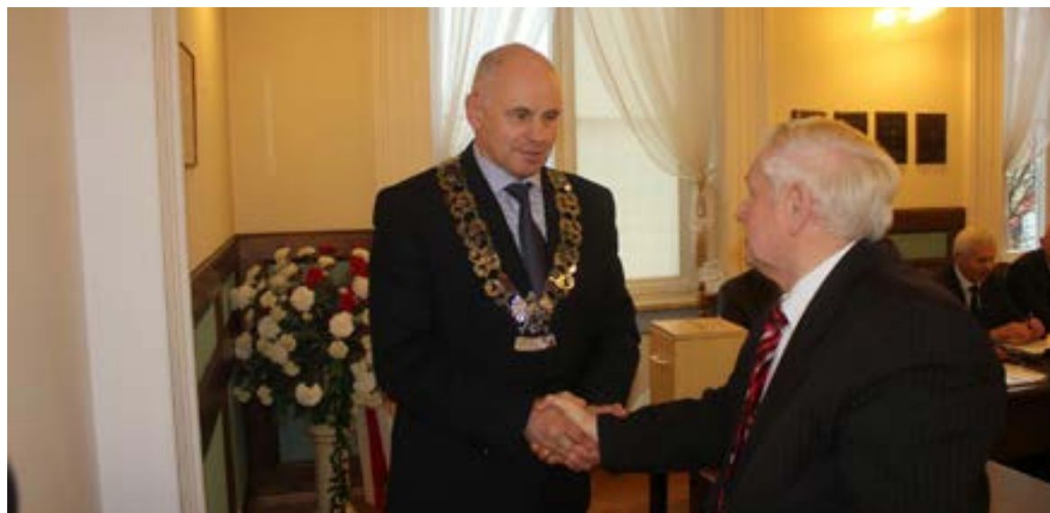
Wałcza” (6 za).