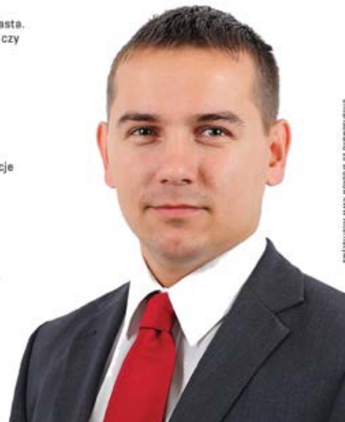
Sfinansowano ze środków KWW Alternatywa

sfinansowano ze środków KWW Wspólny Powiat