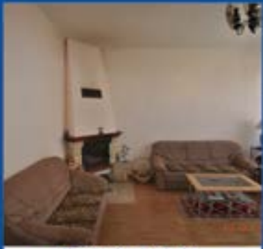
Mieszkanie w kamienicy o pow. 78m 2 3 pokoje. Cena 175 000zł.