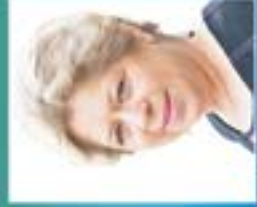
nr 8 Pasada Beata