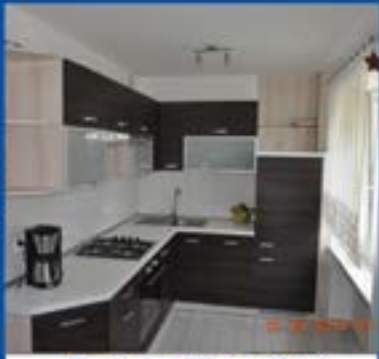
Mieszkanie na DM o pow. 58,4m 2 . Parter, 2 pokoje. Cena 195 000zł.

Pokoje w centrum miasta dla uczniów i studentów. Dostęp do tv i internetu