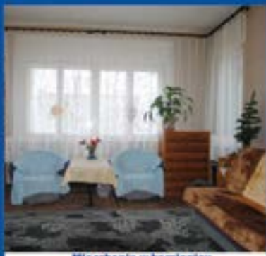
Mieszkanie w kamionicy o pow. 119,5m 2 . Cena 180 000zł.

Pokoje w centrum miasta dla uczniów i studentów. Dostęp do tv i internetu