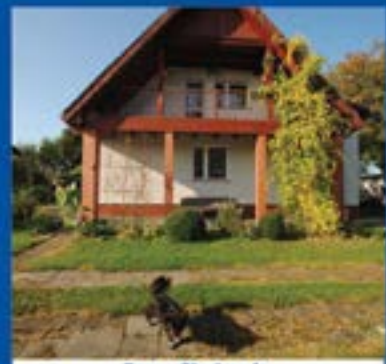
Dom w Chwiranów o pow. 143m 2 . Cena 490 000zł.