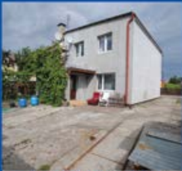
Dom w Wałczu o pow. 249m2. Cena 460 000zł

Pokoje w centrum miasta dla uczniów i studentów. Dostęp do tv i internetu