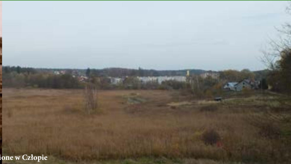
zdjęcia zrobione w Człopie

Drodzy czytelnicy. Jeśli macie ciekawe zdjęcia, które ukazują nam jak było kiedyś, to zachęcamy Was do wysyłania ich na adres extrawalcz@gmail.com . Najciekawsze z nich mogą pojawić się na łamach naszego tygodnika. Szukajcie w szufladach oraz albumach.