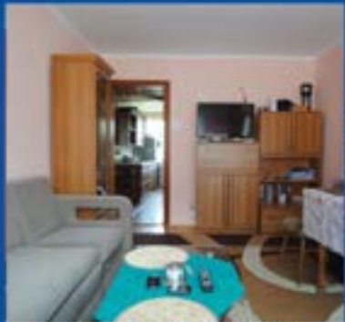
Mieszkanie na o. Kościuszki. 3 pokoje. Cena 154 900zł.