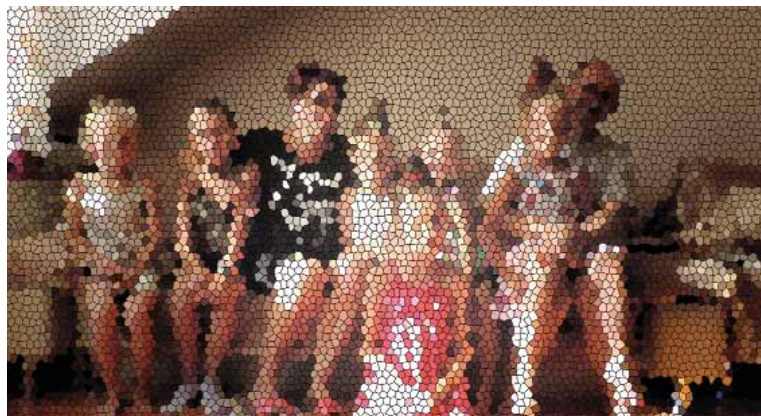
Nie publikujemy wizerunku dzieci ze względu na brak zgody ich rodziców biologicznych.

Dzieci chodzą do szkoły, przedszkola, robimy wspólnie zakupy, sprzątamy – jest tak, jak w każdym domu.