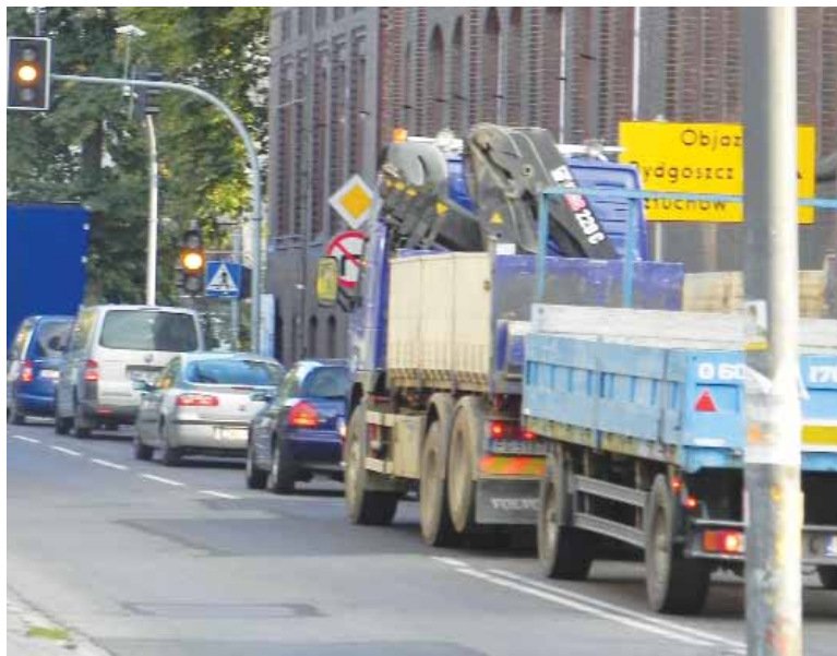
zyjnym – zaznacza poseł P. Suski.

– Należy zaznaczyć, że proces właściwego przygotowania inwestycji rozpoczął się dopiero w 2009 roku po wprowadzeniu specustawy drogowej i środowiskowej. Lokalne oczekiwania pozostawały daleko za tym, co w tej sprawie faktycznie robiono. Obwodnica nigdy nie była realizowana w sposób rzeczowy, planowy, uporządkowany. To, co wielu nazywało projektem, było jedynie kolorową kreską na podkładzie geode-