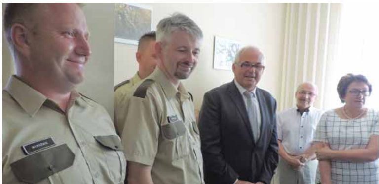
Dokończenie str 1

– Ciężkie zadanie przed wami – zwrócił się do świeżo upieczonych strażników R. Mićko. – Macie świecić i być przykładem przestrzegania prawa. Jeżeli dojdą do mnie sygnały, że zbaczacie z tej drogi nawet jedną nogą, to będę bezwzględny. Polecam was i ten posterunek