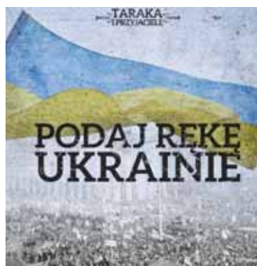
Na płycie utwór „Podaj Rękę Ukrainie” znajduje się w trzech wersjach językowych

– polskim, ukraińskim oraz angielskim. Celem tego wydawnictwa jest również promocja słowiańskiej kultury i tamtejszych muzyków w naszym kraju.