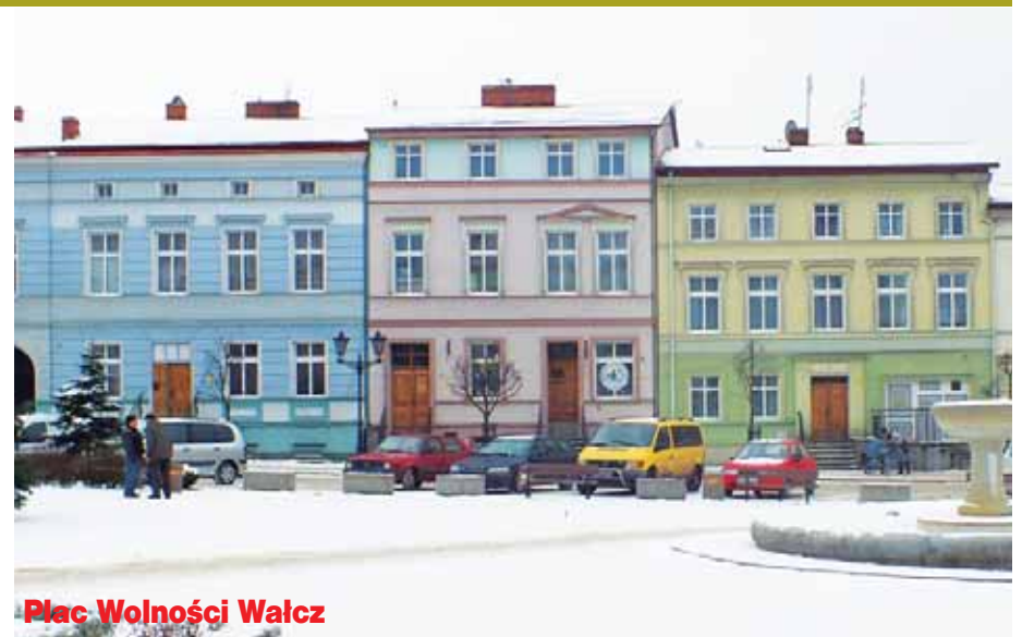
Plac Wolności Wałcz

Drodzy czytelnicy. Jeśli macie ciekawe zdjęcia, które ukazują nam jak było kiedyś, to zachęcamy Was do wysyłania ich na adres extrawalcz@gmail.com . Najciekawsze z nich mogą pojawić się na łamach naszego tygodnika. Poszukajcie w szufladach oraz w albumach.