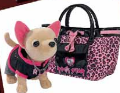
Piesek chi chi love-Vampire