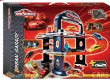
Garaz Majorette czerwony