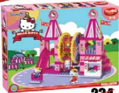
Klocki Hello Kitty Wesole Miasteczko