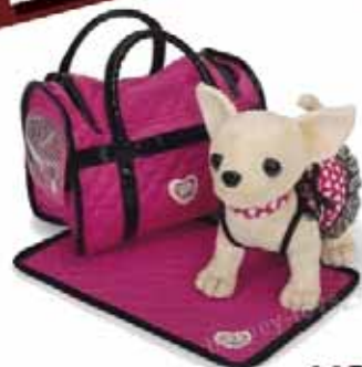
Piesek chi chi love-paris II