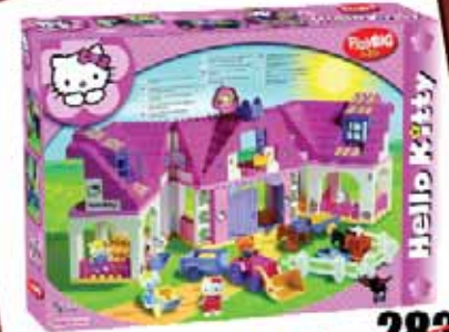
Klocki Hello Kitty Duza Farma Mala Stadnina