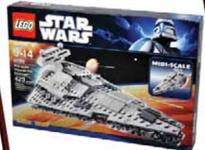
Lego Star Wars