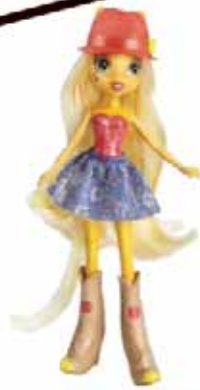
Lalka Equestria My Little Pony