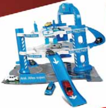
Garaz Majorette Aral niebieski

SKLEP Z ZABAWKAMI WAŁCZ, UL. WOJ. POL. 13/25