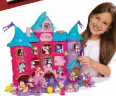
Magiczny zamek Filly