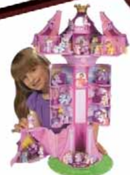
Tęczowa wieża Filly