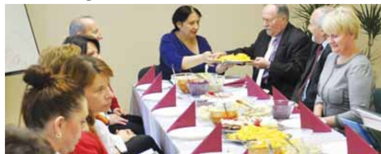
21 listopada pracownicy Powiatowego Centrum Pomocy Rodzinie w Wałczu świętowali Dzień Pracownika Socjalnego.

czu świętowali Dzień Pracownika Socjalnego.