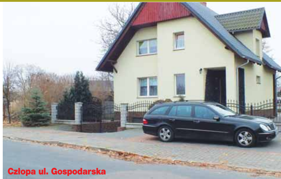
Człopa ul. Gospodarska

Drodzy czytelnicy. Jeśli macie ciekawe zdjęcia, które ukazują nam jak było kiedyś, to zachęcamy Was do wysyłania ich na adres extrawalcz@gmail.com Najciekawsze z nich mogą pojawić się na łamach naszego tygodnika. Poszukajcie w szufladach oraz w albumach.