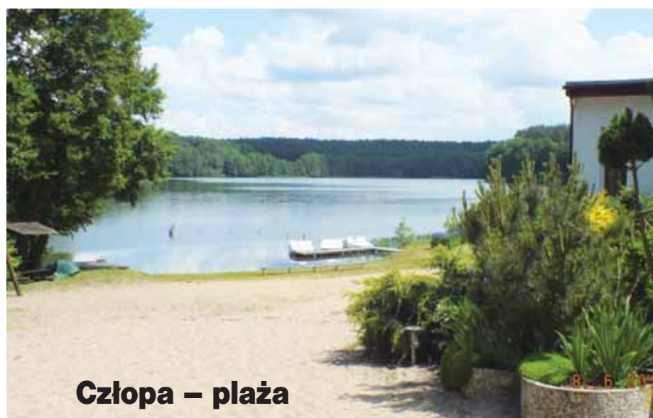
Człopa – plaża

Drodzy czytelnicy. Jeśli macie ciekawe zdjęcia, które ukazują nam jak było kiedyś, to zachęcamy Was do wysyłania ich na adres extrawalcz@gmail.com Najciekawsze z nich mogą pojawić się na łamach naszego tygodnika. Poszukajcie w szufladach oraz w albumach.