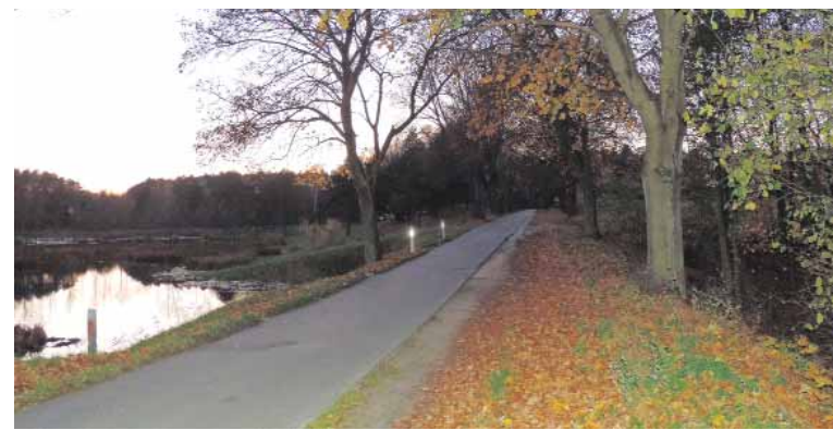
Droga do Strzalin wybudowana została jeszcze przed wojną.

Mieszkańcom pozostaje więc uzbroić się w cierpliwość. ZB