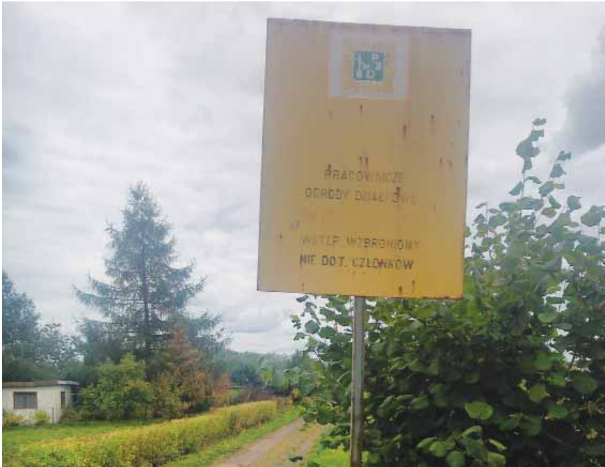
Nadesłane przez Kapik 118