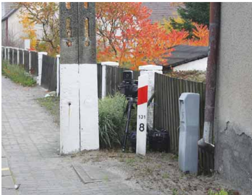
Nadesłane przez Kapik 118

Tutaj jest miejsce na fotografie dziwne, niestandardowe, pokraczne sytuacje, zdarzenia i ciekawostki. Zarówno te absurdalne, banalne, wzruszające, jak i ośmieszające. Zdjęcia zostawiamy „Bez komentarza...”