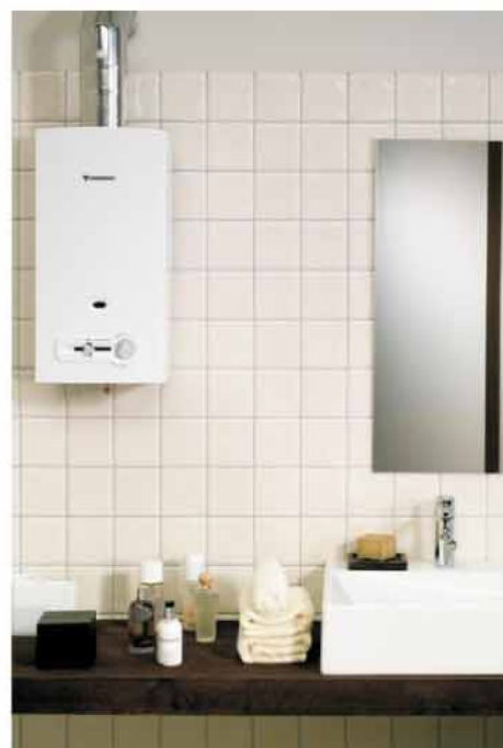
ŁAZIENKA Z JUNEKRSEM

Nasz adres do korespondencji: Zakład Energetyki Ciepłej Sp. z o.o. 78-600 Walcz, ul. Budowlanych 9/4 tel. 67 258 50 32, e-mail:sekretariat@zec-walcz.pl , www.zec-walcz.pl