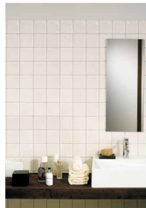
ŁAZIENKA BEZ JUNKERSA