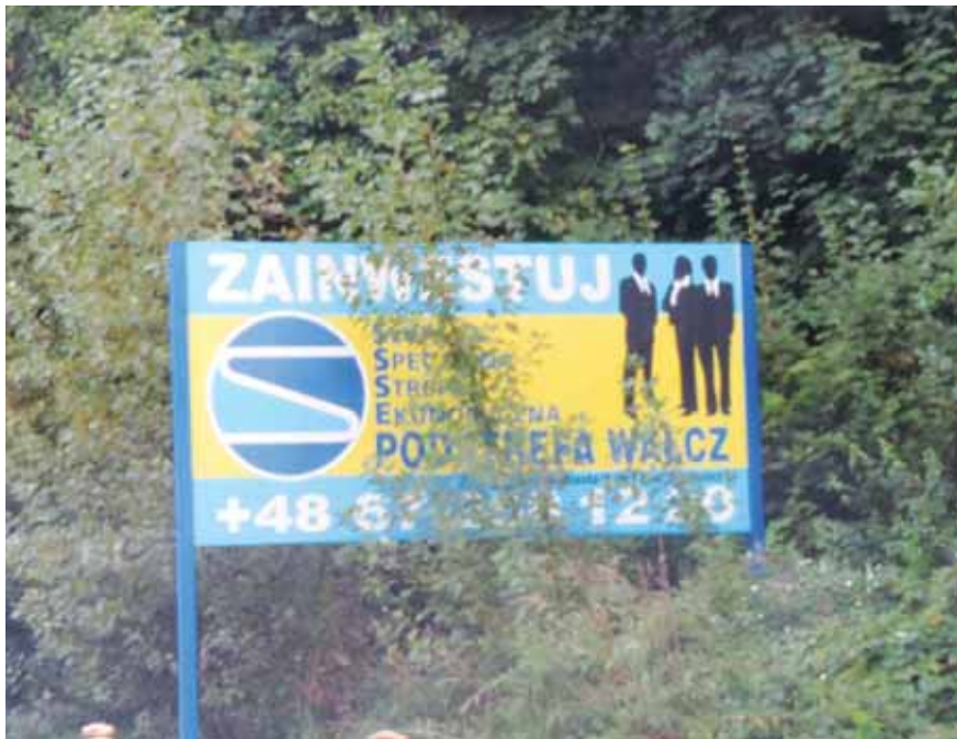
Nadesłane przez Arka Baranowskiego

Tutaj jest miejsce na fotografie dziwne, niestandardowe, pokraczne sytuacje, zdarzenia i ciekawostki. Zarówno te absurdalne, banalne, wzruszające, jak i ośmieszające. Zdjęcia zostawiamy „Bez komentarza...”