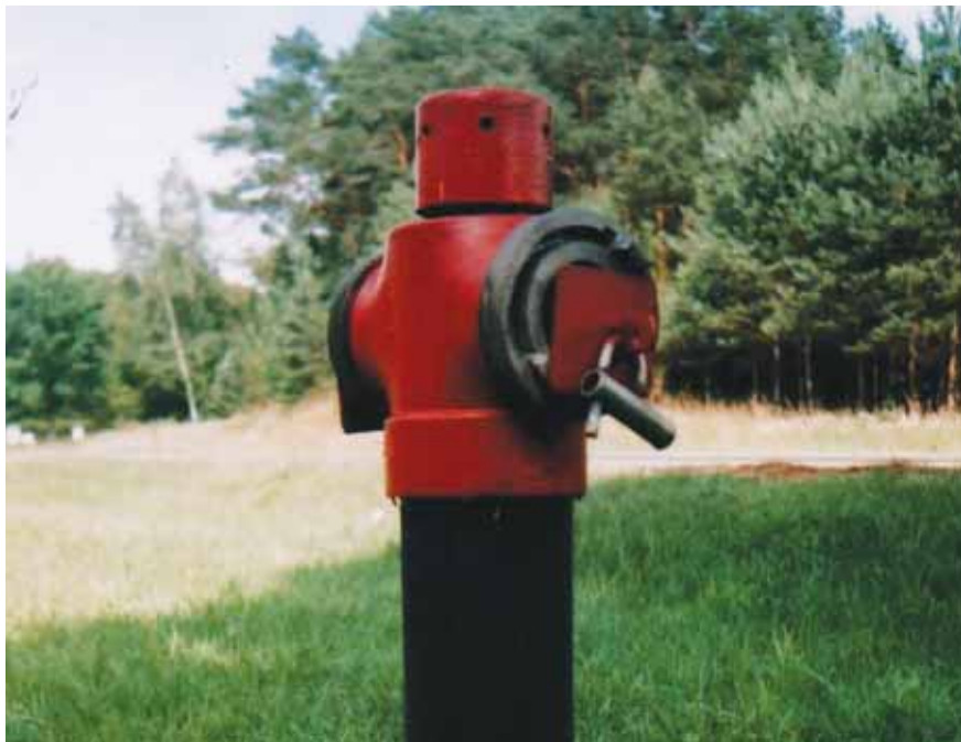
Nadesłane przez Jana Kaczanowicza