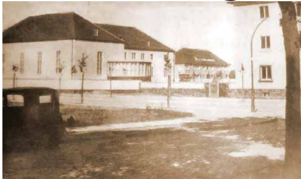
Deutsch Krone. Offiziers-Kasino