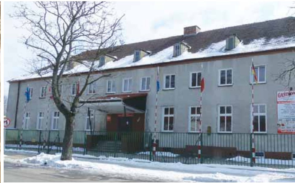
Klub garnizonowy - Wałcz