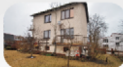
OBNIŻKA CENY Dom wolnostojący w Ostrowcu o pow. 240 m2 cena 395 000 zł