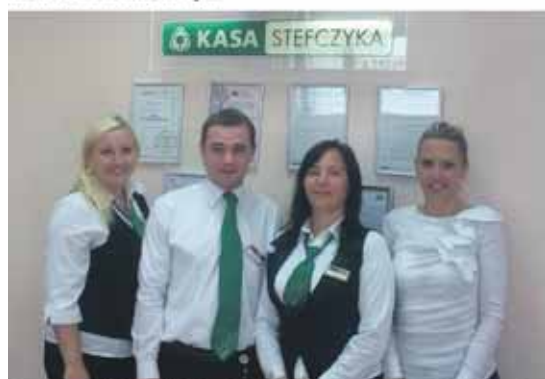
Zapraszamy do placówki Kasy Stefczyka w Walczu przy ul. Kilińszczaków 19.