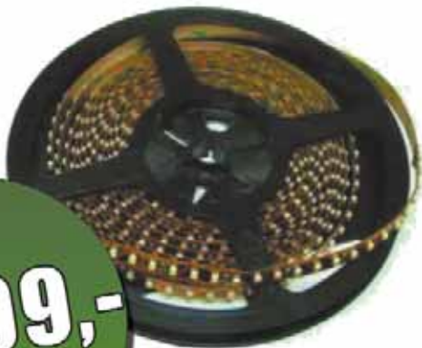
Taśma LED 12V 5mb IP20 3528 biała ciepła