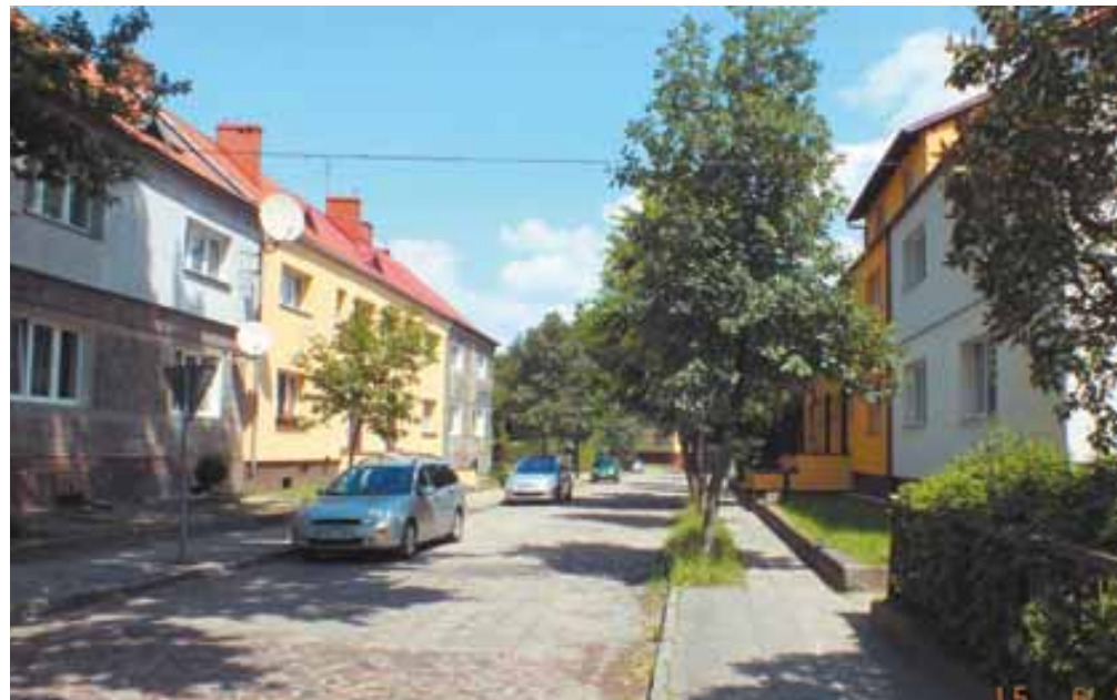
15 6 2