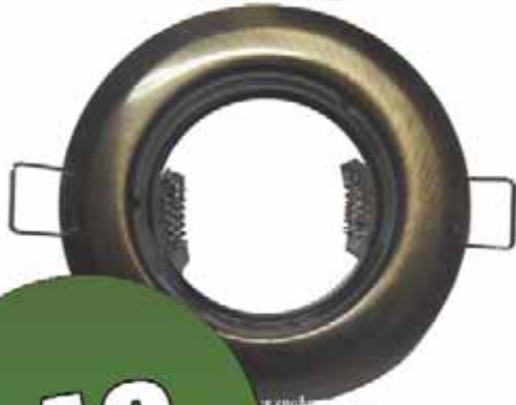
Oprawka halogenowa ALPE 16

SZEROKA OFERTA I NAJNIŻSZE CENY OŚWIETLENIA LED !!!