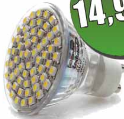
Żarówka GU10 SMD 24LED W