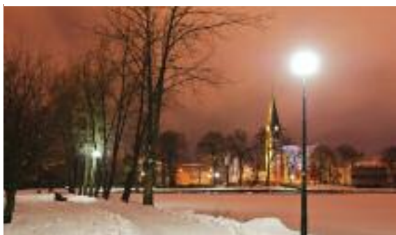
II miejsce-Marta Szczepaniak

4 marca rozstrzygnięta została druga edycja konkursu fotograficznego „Walcz – moja miasto w bieli”