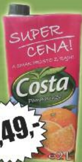
NAPÓJ COSTA 2L