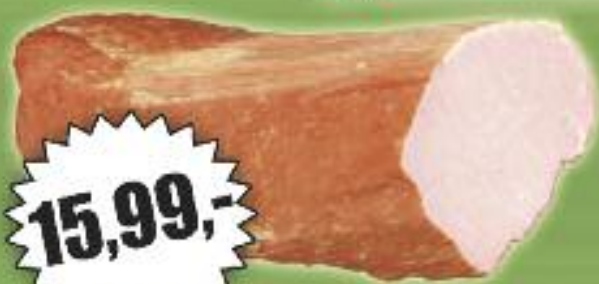
POLEDWICA SOPOCHA / POLSKIE PRZYSMAKI (CENA ZA KG)

WAŁCZ PLAC WOLNOŚCI 10, UL. BYDGOSKA 1 UL. KASZUBSKA 1, UL. KILIŃSZCZAKÓW 70 UL. KOŚCIUSZKI 16A, UL. NOWOMIEJSKA 13