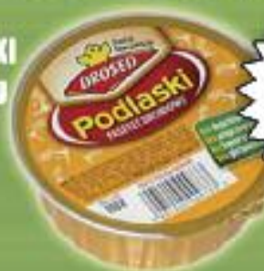
PASZTET PODLASKI DROBIOWY 100 g