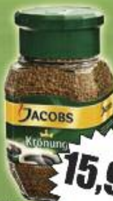
KAWA ROZPUSZCZALNA JACOBS KROUND 100g