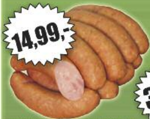
KIELBASA ŚLĄSKA / POLSKIE PRZYSMAKI (CENA ZA KG)