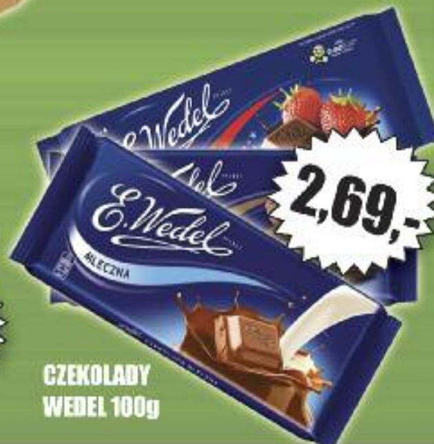
CZEKOLADY WEDEL 100g