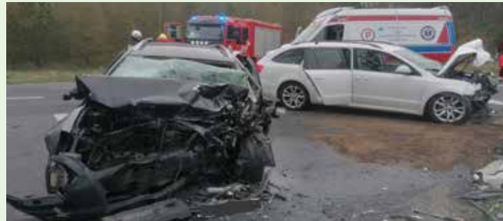
w akcji

Skodą manewr wyprzedzania i uderzył w prawidłowo poruszającą się Toyotę uczestników ruchu drogowego. Osoba kierująca Toyotą jest w ciężkim stanie.